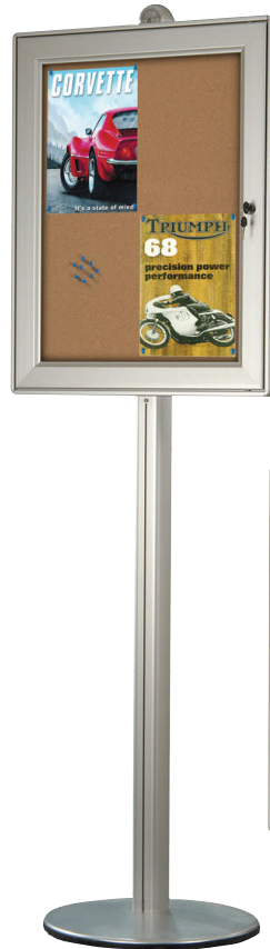
Noticeboard with Cork